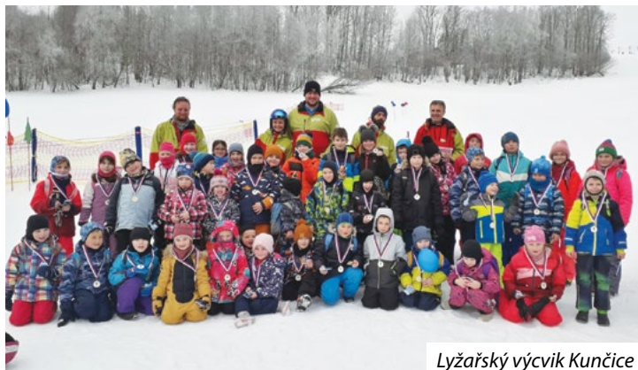
Lyžařský výcvik Kunčice