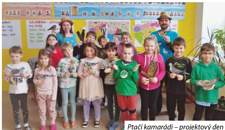
Ptačí kamarádi – projektový den