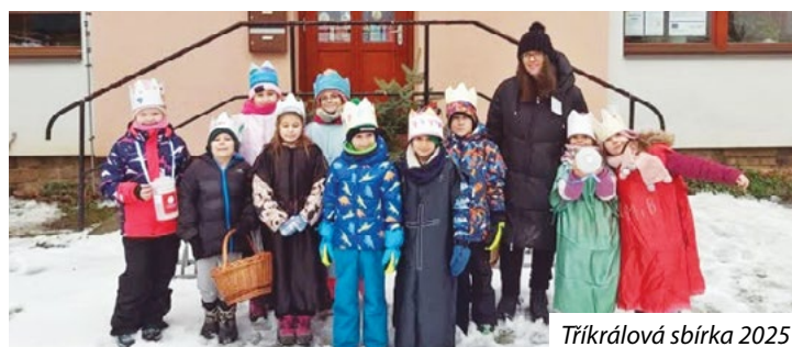
Tříkrálová sbírka 2025