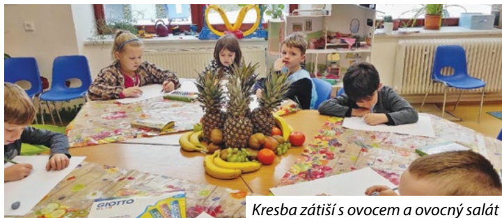
Kresba zátiší s ovocem a ovocný salát