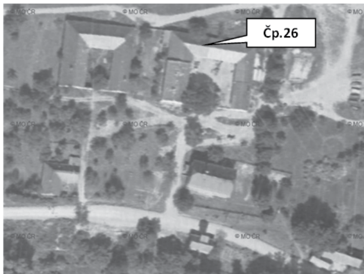
Letecká fotografie z roku 1960