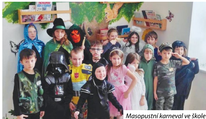
Masopustní karneval ve škole