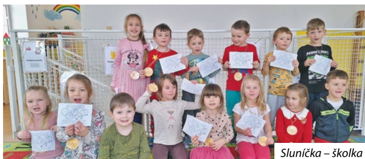
Sluníčka – školka