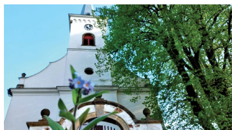
Autor D. Nehyba