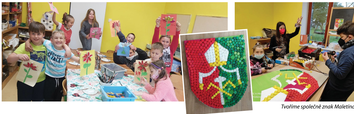
Tvoříme společně znak Maletína