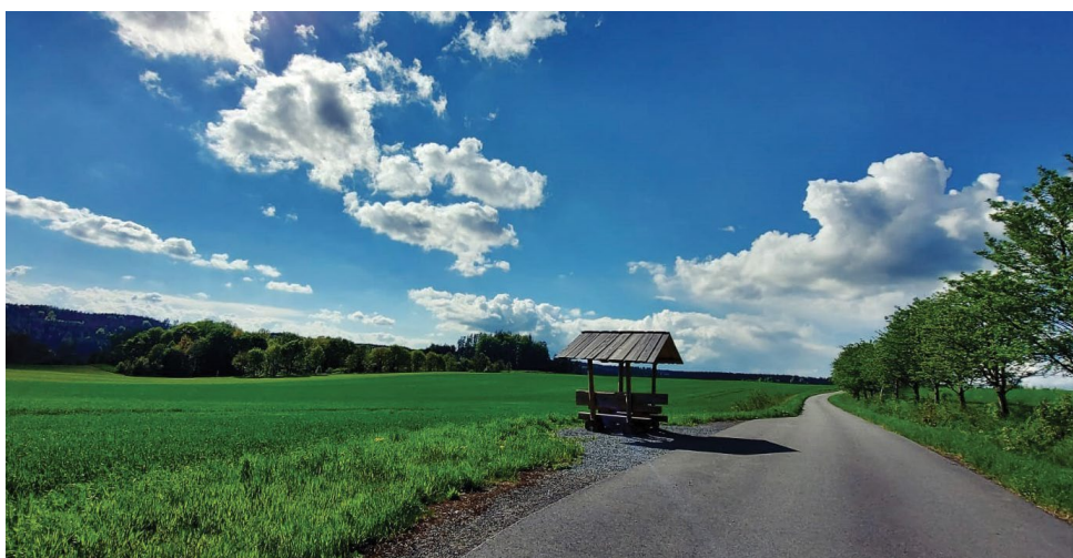
Autor P. Pospěch