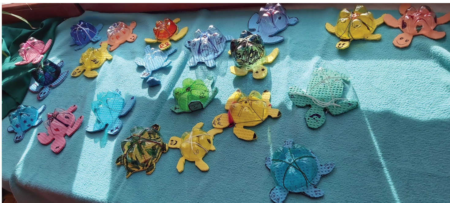
Tvoření z recyklovaných materiálů