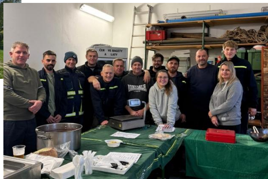
Fotografie z prosincové zabijačky