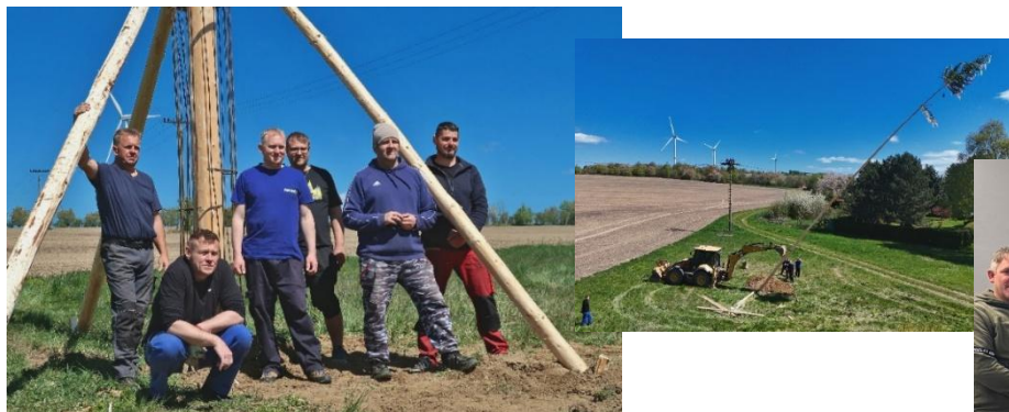
Stavění máje 1. května 2026