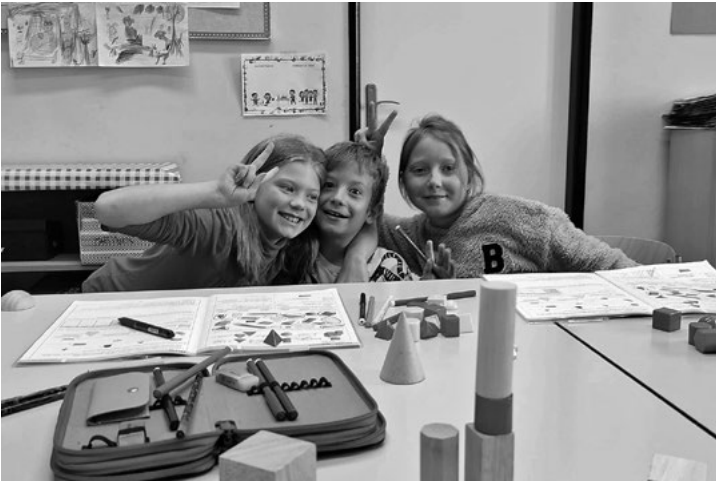
Geometrie nás baví