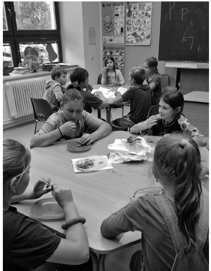
Vaření - řízky na přání dětí