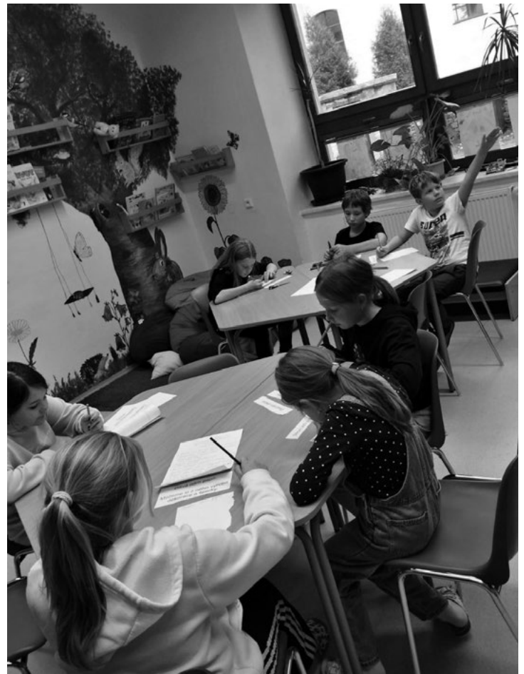
Den stromů ve škole