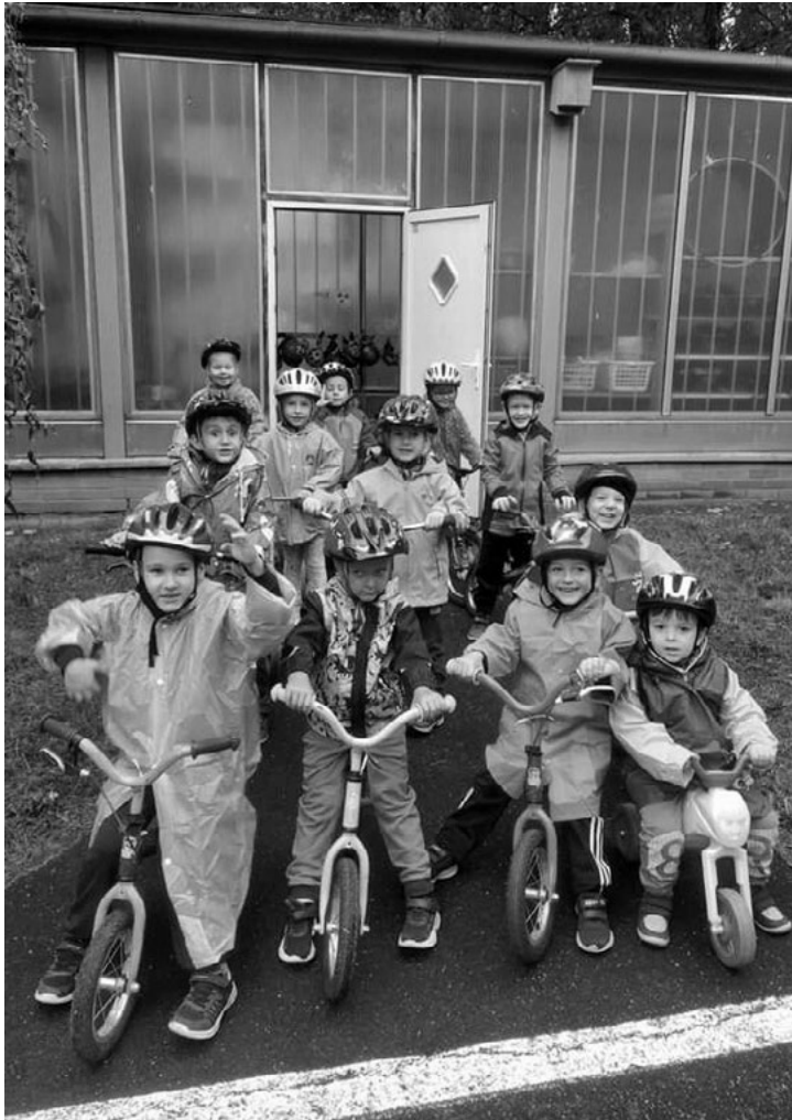
Na dopravním hřišti