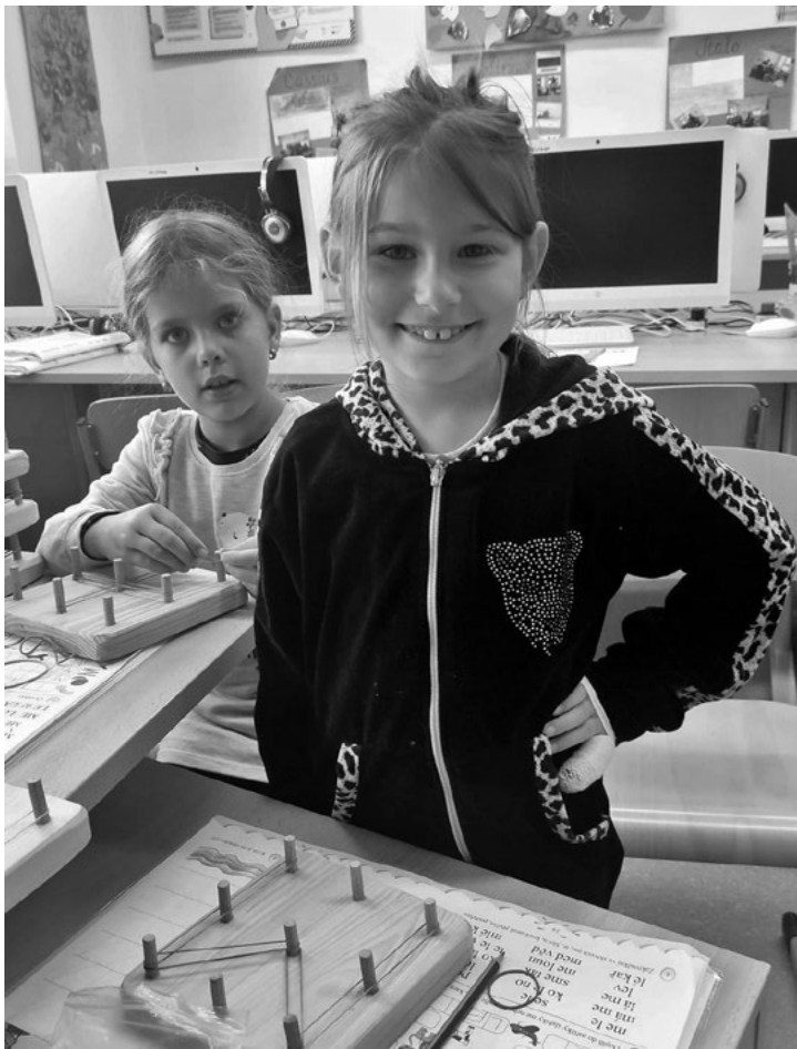
Učíme se písmenka