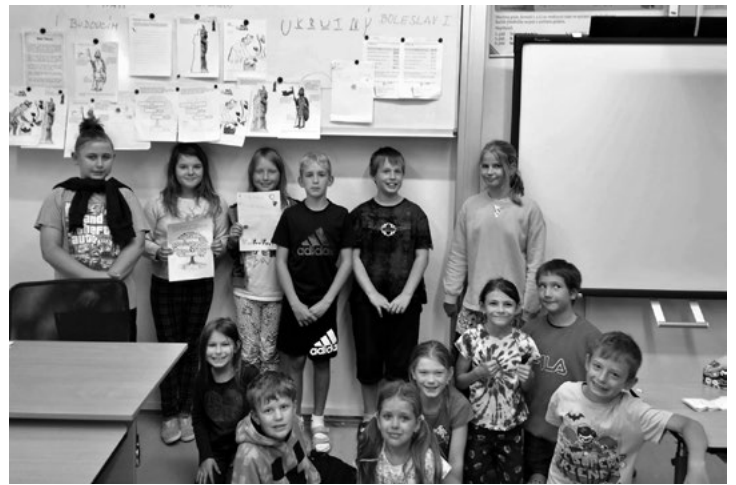
Projektový den Sv. Václav