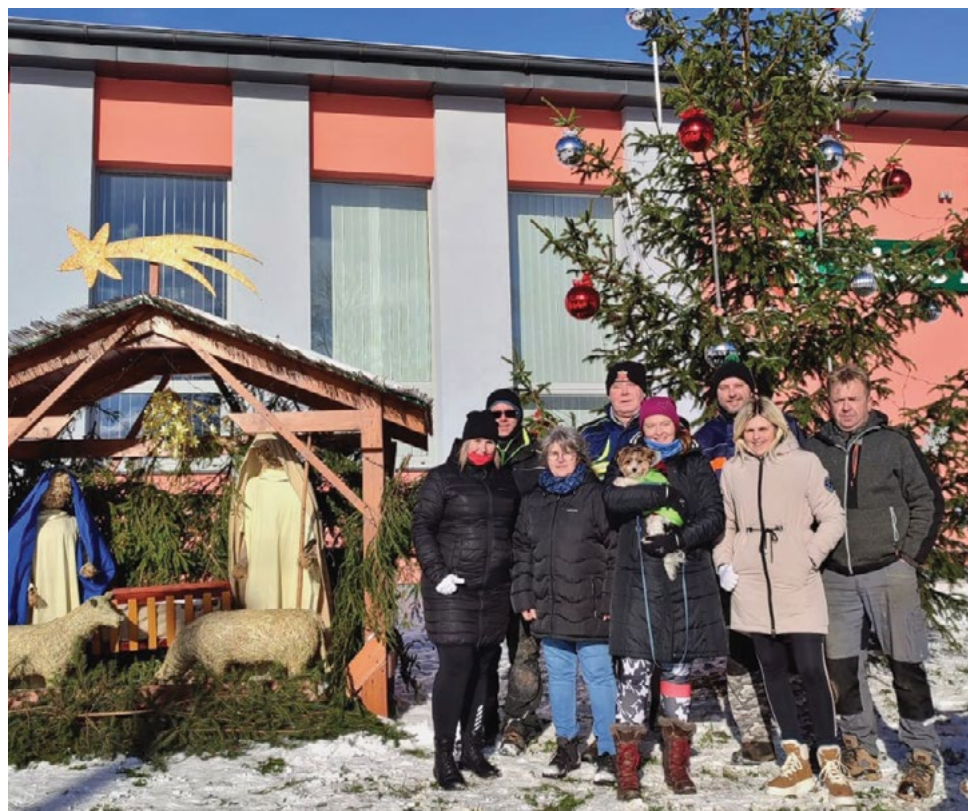
26. 11. 2023 Zastupitelé a Výbor pro občanské záležitosti se sešli před Kulturním domem, aby ozdobili a nachystali obecní vánoční strom s betlémem pro blížící se akci Rozsvícení vánočního stromku, která se konala 1. prosince 2023.