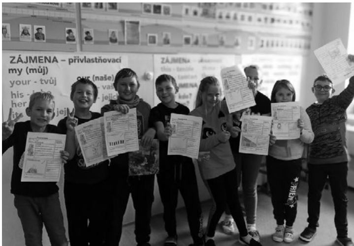
Oblíbená knížka 4. a 5. třída