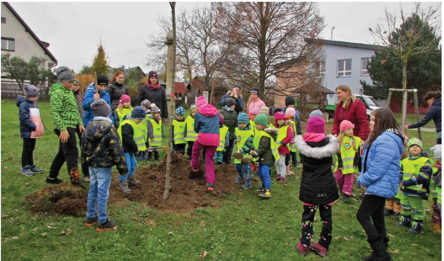
Fotografie z akce Knihobraní – sázení stromů