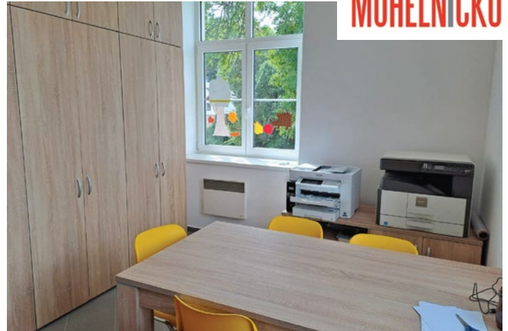
Kabinet po opravě