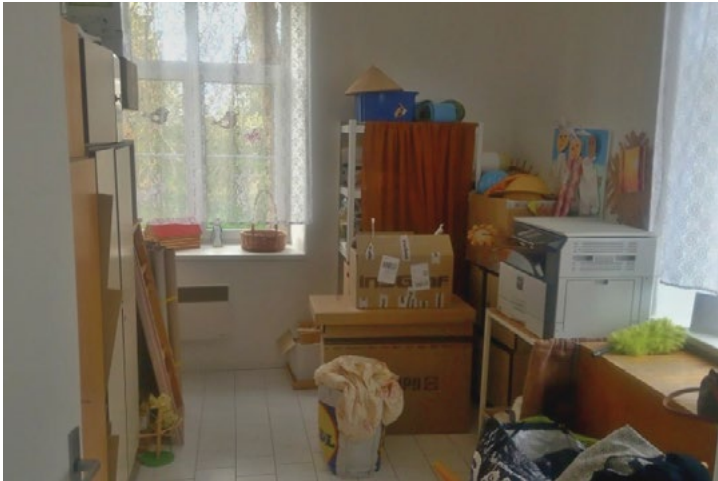
Kabinet před opravou